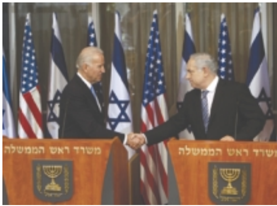
مصافحة بين بايدن ونتياهو خلال مؤتمر صحفي في القدس

طمان جو بايدن نائب الرئيس الاميركي اسرائيل امس على التزام واشنطن بامنها ومنع ايران من انتاج اسلحة نووية. وقال بايدن ايضا ان استئناف المحادثات الاسرائيلية الفلسطينية المتفق عليه يوفر «لحظة تتاح فيها فرصة حقيقية للسلام».